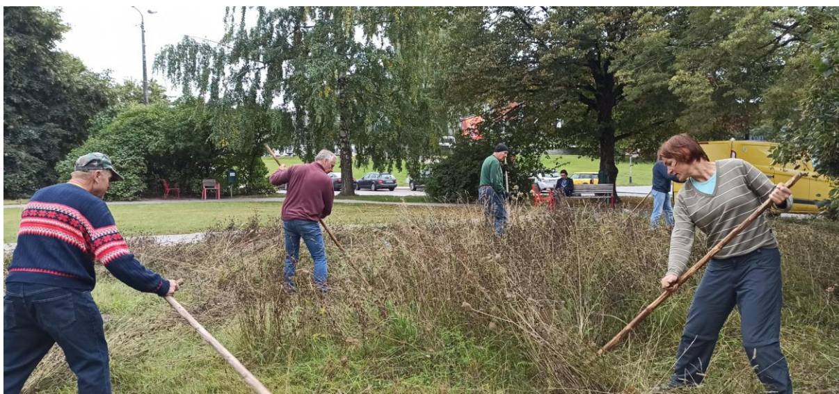
Kureeritud Elurikkuse korraldatud linnaniidu ühisniitmine Tartu Uueturu pargis 13.09.2022.

2022. aastal võis näha ELFi varasemate aastate igähe looduskaitse tegevuste mõju - toimus erinevaid iseseisvaid vikatiga niitmise üritusi, kus ELF ei olnud enam korraldaja rollis, vaid lõi kaasa osalejana.