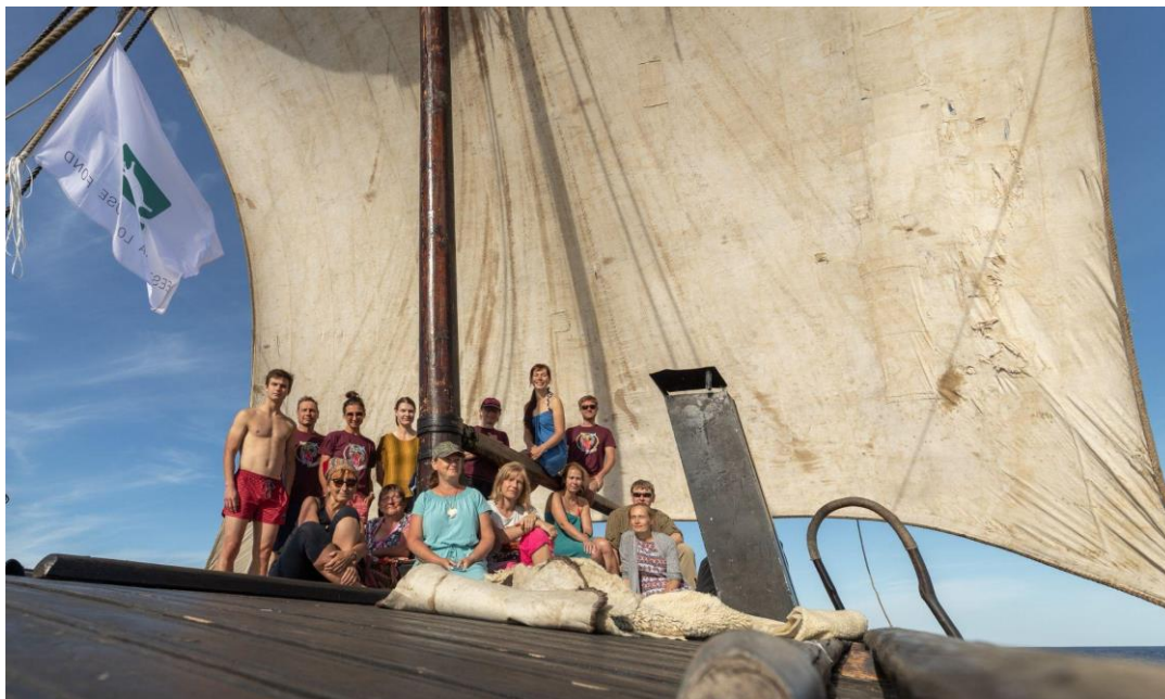
Piirissaare talgulised ja talgulodi Jõmmu.

2022. aastal korraldas ELF 57 looduskaitsetalgut , kus osales 763 talgulist ning tehti 6175 tundi tööd. Talgutel veedeti ühtekokku 186 päeva. Toimunud talgutest olid 49 avalikult meie kodulehel üleval (37 eesti-, 7 inglisi- ja 5 venekeelsena) ning 8 korraldati ette tellitud gruppidele (ettevõtted, kooliklassid jne). Toimus 16 talgut kahepaiksete (mudakonn 9, kõre 5, harivesilik 2), 14 talgut lindude (niidurüdi 10, must-toonekurg 4) ja 11 kaitsealuste taimede ja pärandkoosluste heaks (käpalised 3, kukemarjanõmm 3, puisniidud 2, loopealsed 3). 5 talgul tõrjuti invasiivseid võõrtaimeliike (verev lemmmalts 4, kurdlehine kibuvits 1), 2 talgul tegeleti püsimeetsandusega ning 2 talgul seirati lendoravate elupaiku. 3 talguüritust oli suunatud spetsiaalselt noortele (vanuses 15-35) ning nendel talgutel abistati mahetalunikke ja vesteldi keskkonnasõbraliku toitumise teemadel. 1 talgu kuulutati välja vanavanematele ja lastelastele ning 1 Ukraina pagulastele. 12. korda toimusid looduskaitse talgute toidulaua toetuseks sügisesed moositalgud. Piirissaarele sõitis talgulodi Jõmmu. Vaata ka: https://www.talgud.ee/talgud/talgute-moju .