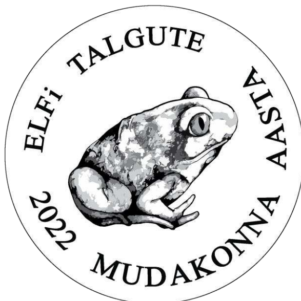
Mudakonna teema-aasta logo.