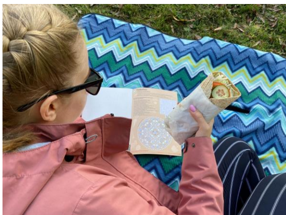
Vrapi väljakutse 2022 sügis.

Teavituskampaania hõlmas mitmeid kaasavaid tegevusi sotsiaalmeedias (nt planeedisõbraliku vrapi tegemise üleskutse ja planeedisõbraliku pühade söömaaja korraldamine).