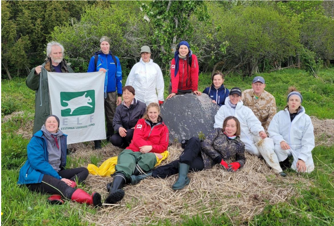
Masuudikoristajad Hobulaiul, 29.05.2022.