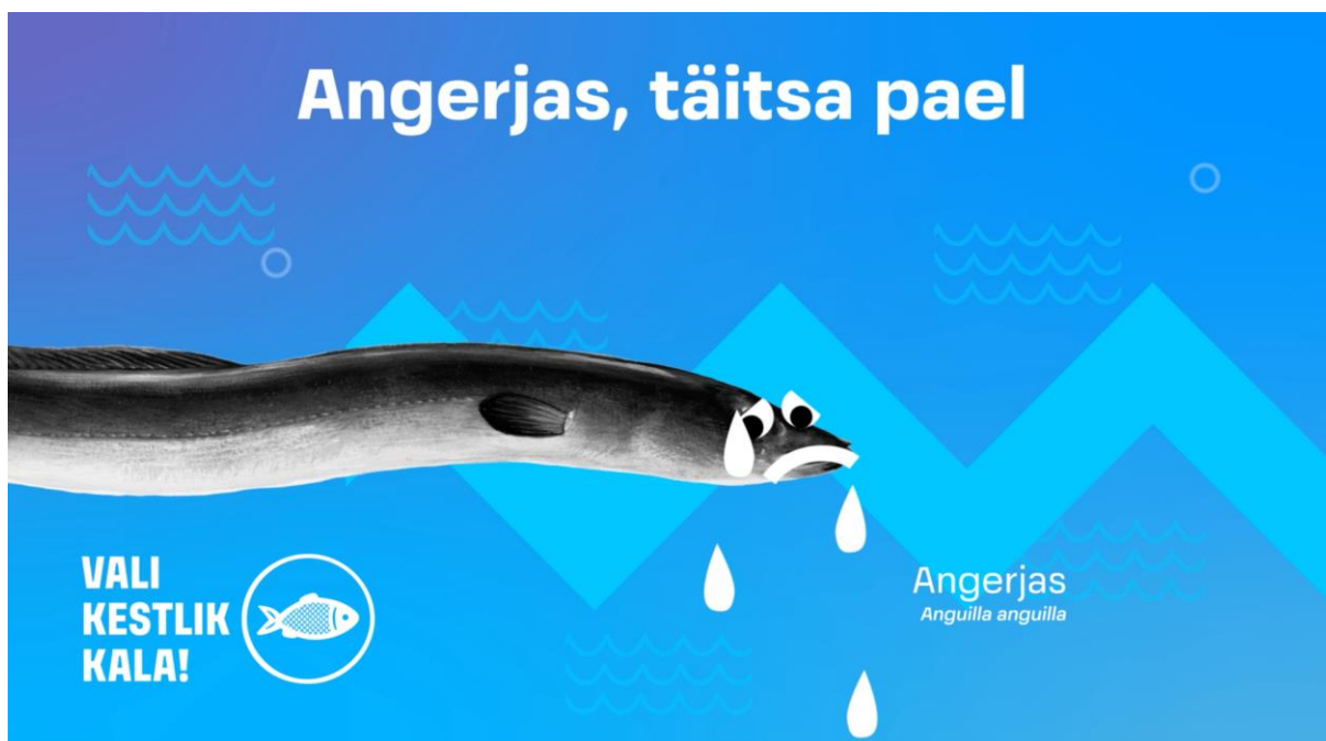
Kuvatõmmis kestliku kalatoidu kampaania tarbeks valminud animatsioonist

ELF osales kalandusega seotud töörühma koosolekutel, kalandusnõukogu istungitel ning andis sisendit Euroopa Merendus- ja Kalandusfondi (EMKF) tegevusele. Toimusid ümarlaud eri osapoolte vahel (ministriumid, kalanduse esindajad, jaemüüjad ning teadlased). ELF andis hinnangu Keskkonnaministeeriumi püügisoovidele ning selgitas Läänemere kalanduse seisu üldisemalt. Eri riikide keskkonnaorganisatsioonide ühise tegevuse tulemusel pikendati angerjapüügi keeluaega Läänemeres kolmelt kuult kuuele kuule, mille tulemusel kriitiliselt ohustatud angerjapüük praktiliselt peatub.