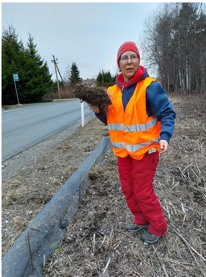
Konnatõkke paigaldamine Ihasalus.

2022. aastal soetati ja jagati konnatalgute juhtidele taas varustust (ämbrid, kindad, pealambid, helkurvestid, infovoldikud, konnatõkked) ning suunati huvilisi konnapäästele appi. Autorataste alt päästeti enam kui 15 paigas üle Eesti 21 267 kahepaikset: 18 937 harilikku kärnkonna, 1778 rohukonna, 402 rabakonna, 146 tähnikesilikku ja 4 veekonna. Vabatahtlikud käisid talgutel 571 korda ja panustasid 454 töötundi. Kõige tihedam kahepaiksete ränne toimus Põltsamaal, kus vabatahtlike abiga päästeti 5827 konna. Tihedalt kannul oli Porkuni 4966 kahepaiksega ning järgnesid Sillamäe 2145, Astangu tee Tallinnas 2021, Nelijärve 1486, Ruu-Ihasalu 1313 ja Rae vald 1246 konnaga.