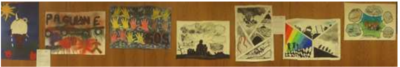
Valik konkursitöödest, mida esitleti ka oktoobris toimunud rahvusvahelisel konverentsil Tartus.

Projekti eesmärgiks on aidata kaasa maailmahariduse teemade tutvustamisele Eesti ääreala koolides - Mustvees, Alatskivil, Rāpinas, Kallastel ja Maarja-Magdaleenas. Projekt aitab parandada teadlikkust arengukoostöö vajadusest; sellest, kuidas me oleme seotud globaalprobleemidega, solidaarsust ja tolerantsust "teiste" suhtes. 2016. a. toimus õpetajate koolitus maailmahariduse meetoditest, korraldati maailmanädalad koolides ning