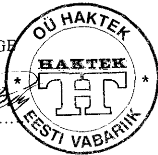
Priit Pärn Haktek OÜ juhatuse esimees