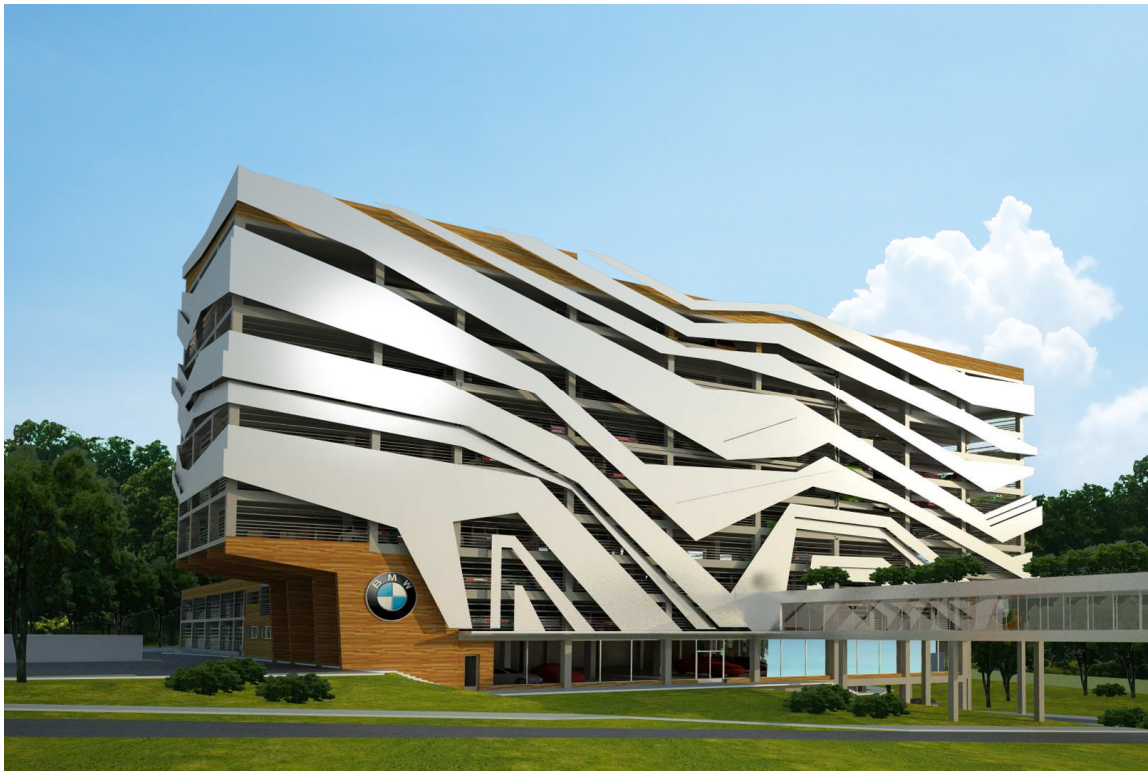
Pildil: Mitmekorruseline parkimismaja, Himki, Venemaa.

IP EA Reng Projecti jaoks oli 2013 hea aasta. Teostati mitmeid kasumlikke projekte nii kohalikele tellijatele kui ka ekspordiks. Aasta möödus kohaliku valuuta mõõduka languse tingimustes mis aga ei avaldanud olulist mõju majandusnäitajatele. Eelmise aastaga võrreldes tõusis käive koguni 47% 0,26 milj. €-lt 0,38 milj. €-ni. Eelmise aasta kasum suurenes peaaegu kaks korda 0,015 milj. €-lt 0,027 milj.€-ni, bilansimaht muutus 0,124 milj.€-lt 0,139 milj.€-ni. Käibeplaan täideti 75% ulatuses ning kasumit teeniti 7% käibest.