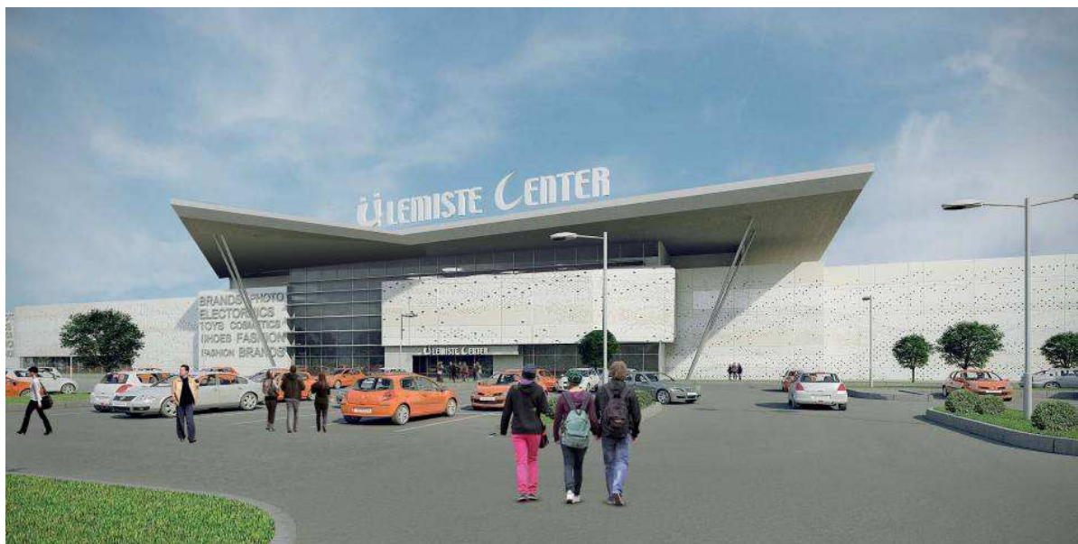
Pildil: Ülemiste kaubanduskeskuse laiendus, Tallinn

Äritegevuse võtmesõnaks eelmisel aastal oli aktiivne müügitöö nii sise- kui välisurgudel. Vastavalt strateegilistele eesmärkidele jätkati tehnoloogilise taseme tõstmist, samuti väljundite otsimist jõukamatele välisurgudele. Nendeks on eelkõige Norra, aga ka Suurbritannia, Soome ja Rootsi. Põhiliselt BIM kogemusel baseeruva ekspordi tulemustega võib rahule jääda. Kuigi ekspordi numbrite osas toimus teatav väike tagasimineku, loodi väga head tingimused uuel tasemelt välisurgudele minekuks.