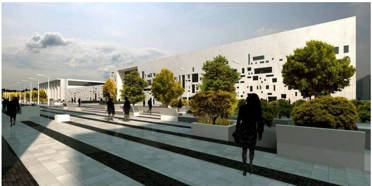
Pildil: Tondiraba jäähall, Tallinn

EA Reng AS käive kasvas kontserni käibest kiirema tempoga: 22% (2,72 milj. €-lt 3,33 milj. €-ni). Sõlmiti mitmeid häid lepinguid, nii et kuni sügiseni olime olukorras, kus portfellis oli tugevalt üle aastamahu jagu töid. Aasta lõpukuudel aga toimus väike tagasilangus, kus paljud tööd venisid ja lükkusid järgmisse aastasse. Käibeplaan täideti lõpuks 101%. Kasumit teeniti 0,033 milj.€. Kasumimarginaal aga on jätkuvalt madal (1%) kuid siin tuleb arvestada, et osa kasumist investeeriti aasta jooksul firma arengusse nii et kasum ilma arengukulud arvestamata oli 8%. See oli suuresti seotud Norra tütarfirma käivitamisele suunatud kulutustega ning osaliselt palkade ja preemiate jätkuva taastamisega masueelsele tasemele. Bilansimaht vähenes 10% (1,318 milj. €-lt 1,185 milj. €-ni).